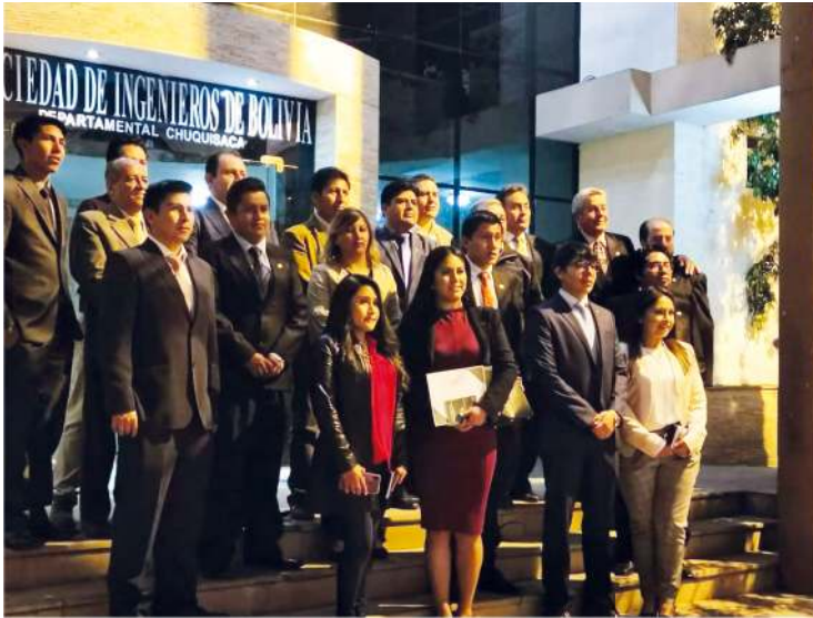
ILUMINACIÓN DEL FRONTIS DEL EDIFICIO DE LA SIB CHUQUISACA (04/10/2019)

Conmemorando el Día del Ingeniero Boliviano, la Sociedad de Ingenieros Departamental Chuquisaca, organiza un programa especial de festejos.