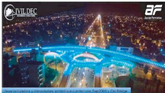
Travor calculadora y computadora portátil que cuenten con Sap2000 y Cal Bridge