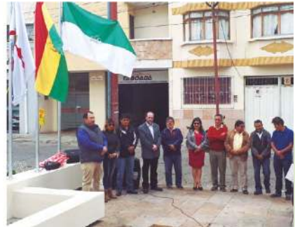
OFRENDA FLORAL EN LA PLAZUELA DEL INGENIERO (05/10/2019)