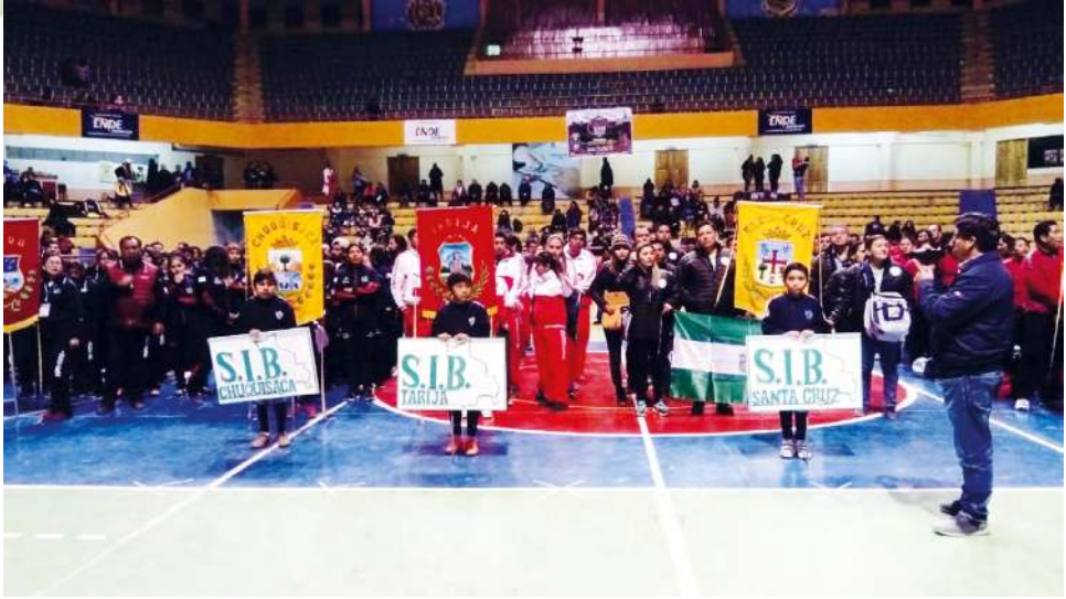
DELEGACIÓN CHUQUISACA EN LOS XXIII DEPORTIVOS NACIONALES DE LA SIB